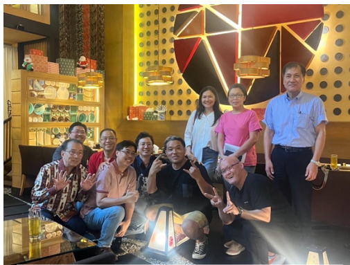
商談会に参加された富山新世紀産業機構 伍嶋理事長（右端）やバイヤー関係者